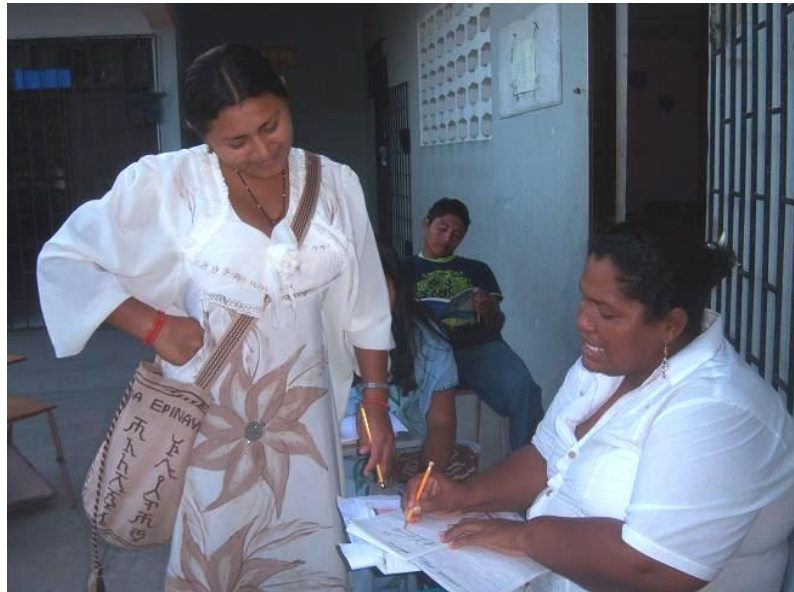
Gráfica 3. La facilitadora (derecha, sentada) realimenta las evidencias de aprendizaje de una estudiante Wayuú (a la izquierda y de pie). La foto pertenece a la prueba piloto del PAVA en la Guajira.

Así surge, entonces, el PAVA como una alternativa innovadora y diferenciadora en cuanto a la educación de jóvenes y adultos iletrados existentes en el país apoyados en TIC como el computador y la internet. Por eso, la Católica del Norte Fundación Universitaria, mediante el Cibercolegio UCN, diseñó la propuesta del PAVA en febrero de 2008, la misma que fue aprobada por el MEN. La condición exigida por el Ministerio fue realizar una prueba piloto en la Guajira (ver gráfica 3) con 350 jóvenes y adultos en calidad de estudiantes la mayoría pertenecientes a la etnia Wayuú, en el segundo semestre de ese mismo año.